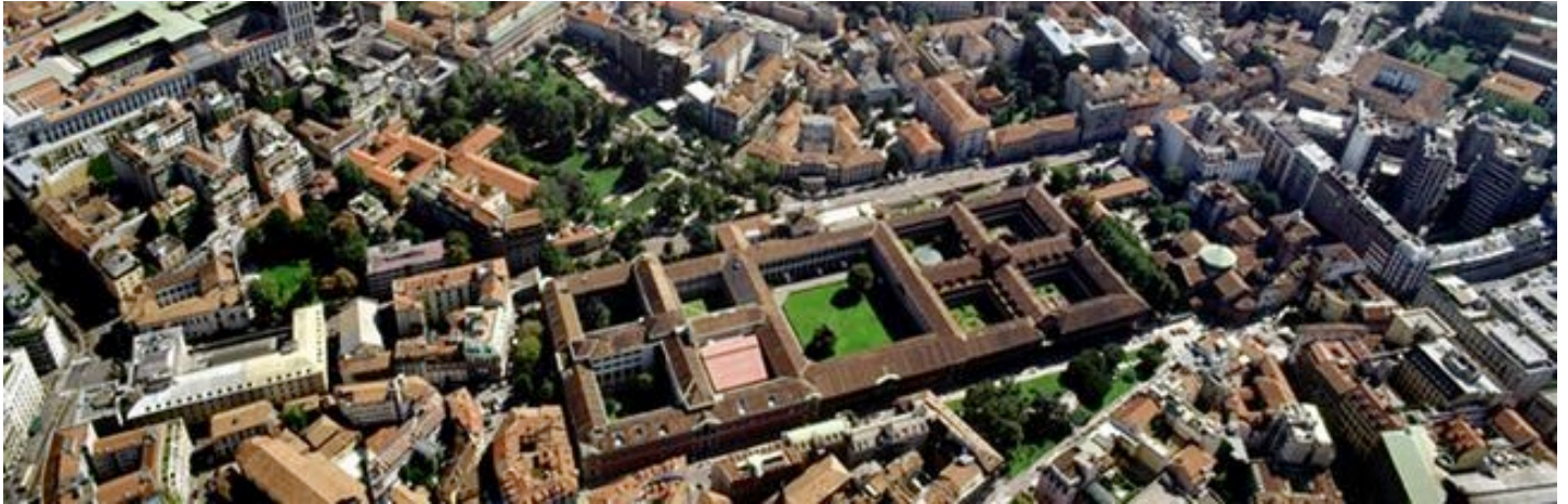
Vista aerea della Ca' Granda oggi sede dell'Università degli Studi di Milano e dell'Archivio dell'Ospedale maggiore