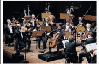
Visto allo Stelio Molo per 'Osi in Auditorio'

Mi è sembrato un Notturmo trafitto da sussulti dinamici laceranti, una musica impressionista carica di introspezione. Mi ha richiamato "Il lampo" di un poeta nato un secolo prima di Azarashvili: "...una casa apparì spari d'un tratto; come un occhio, che, largo, esterrefatto, s'apri su chiuse, nella notte nera".