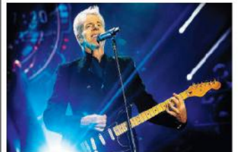
'Termino le mie attività entro il 2026'

Pressoché contemporaneamente all'annuncio, Sony Music ha comunicato l'acquisto dell'intero catalogo di Baglioni. Oggetto della transazione è il repertorio pubblicato dal 2004, in precedenza già in licenza con la major, che ora è proprietaria dell'intera discografia dell'artista. ATS/RED