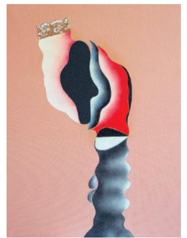
Flavio Paolucci, periodo pop