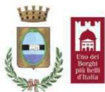
Città di San Benedetto Po