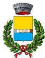
Comune di Bagnolo San Vito